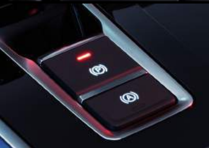
FRENO DE MANO ELECTRÓNICO EPB CON AUTOHOLD