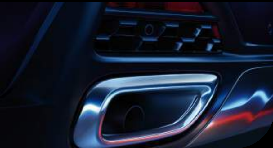
Salida de escape doble con detalles cromados

SU IMPRESIONANTE SPOILER DEPORTIVO, ANTENA TIPO TIBURÓN Y LÍNEAS DE DISEÑO INTEGRADAS, LE OTORGAN UN ASPECTO CORPULENTO Y A LA VEZ ELEGANTE.