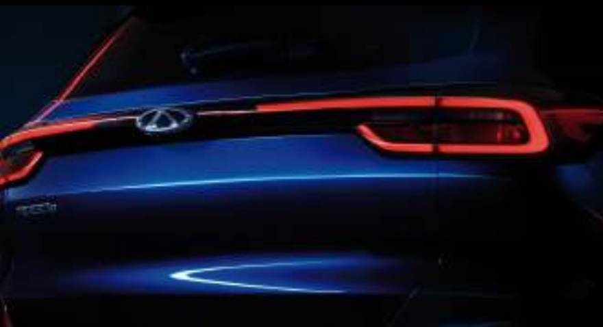
Impactantes luces LED traseras de gran visibilidad