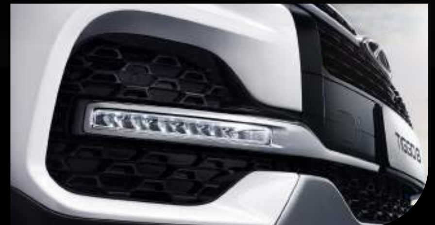
SISTEMA DE LUCES LED DIURNAS (DRL)