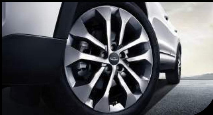
AROS DE ALEACIÓN DE 18"