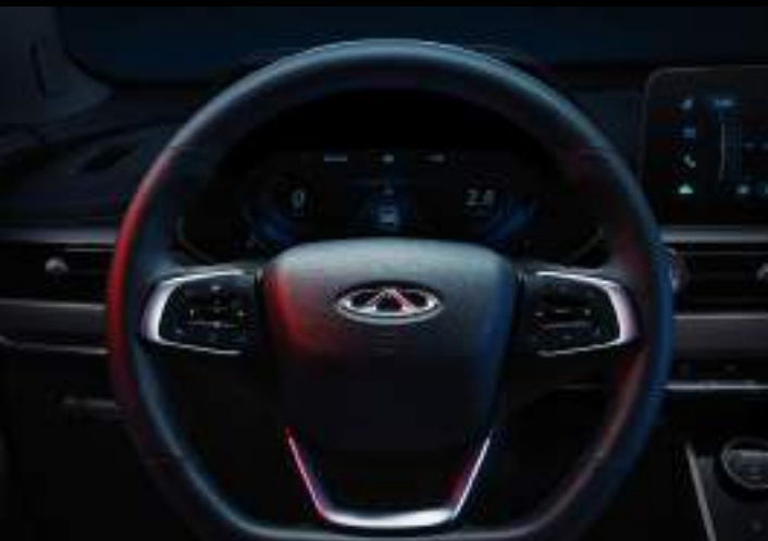
VOLANTE DE CUERO MULTIFUNCIÓN