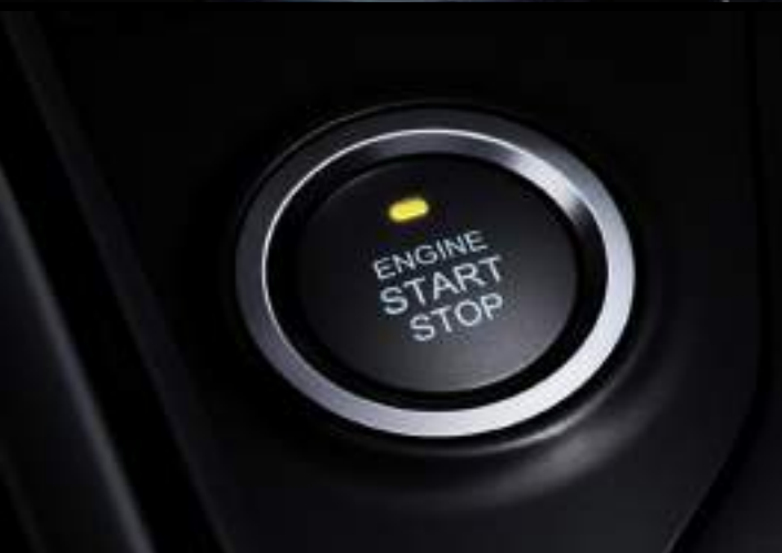
BOTÓN DE ENCENDIDO