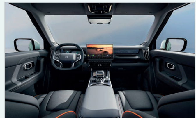
Black & Orange